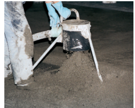
PCI Novoment Z3 für beschleunigt härtende Estriche hat eine lange Verarbeitbarkeitsdauer von ca. 1 Stunde und ist – auch bei höheren Temperaturen – für Pumpenförderung geeignet.