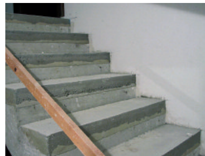
Aufgrund seiner Eigenschaften eignet sich PCI Novoment M3 plus auch hervorragend zum Höhenausgleich von Betontreppenstufen.