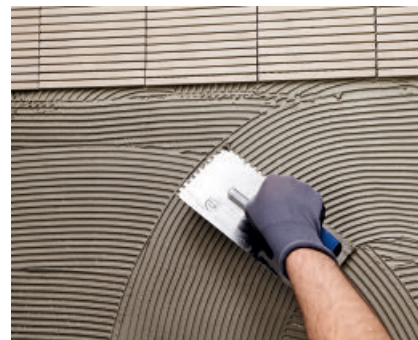
PCI Flexmörtel S1 Rapid insbesondere für zeitbedrängte Arbeiten.

Verlegeuntergründen, Glas- und Porzellanmosaik, festhaftende PVC-Beläge und alte Keramikbeläge. ■ Für die Verlegung von Polyurethanschaum-Platten an erdberührten Kellerwänden (Perimeterdämmung) auf Putz, Beton, Mauerwerk und Dichtschlämmen; für Mineralfaserplatten (z. B. Isover oder Rockwool), für gesägte Hartschaumplatten (z. B. Styropor oder Hostapur), für extrudierte Hartschaumplatten (z. B. Styrodur). ■ Zum Ausbessern und Ausgleichen kleinerer Unebenheiten auf Wand- und Bodenflächen, vor der Verlegung von Fliesen und Platten.